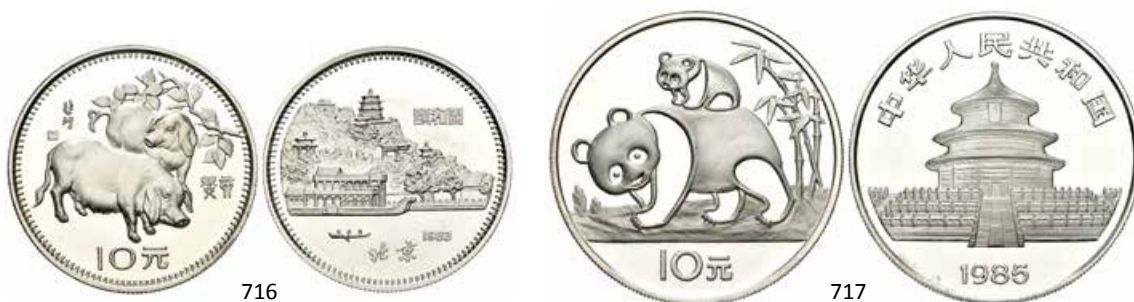
716 China. 10 yuan. 1983. (Km-73). Ag. 15,06 g. Año del cerdo. PROOF. Est...900,00.