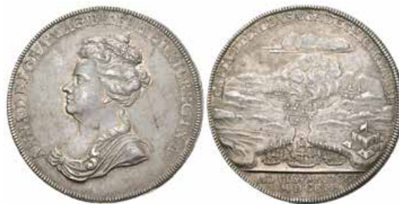
777 Gran Bretaña . Anna. Medalla. 1702. (Eimer-395). Ag. 17,48 g. Batalla de la Bahía de Vigo. Acuñada en conmemoración de la invasión inglesa en Galicia. Rayitas en anverso. Rara. EBC. Est...600,00.