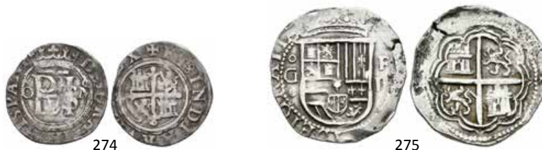
274 1/2 real. México. O. (Cal-718). Ag. 1,47 g. Monograma entre O-M. Escasa. MBC-. Est...160,00.