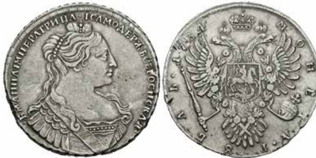
768 Rusia. Anna. 1 rublo. 1734. (Km-197). (Bitkin-110). Ag. 25,68 g. MBC+. Est...500,00. 300