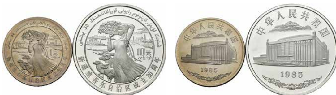
715 China. 1985. Lote de 2 monedas, 1 yuan (nickel) y 10 yuan (plata). 30º Aniversario de la Autonomía de Xinjiang. En estuche original y con certificado oficial. PROOF. Est...1600,00.