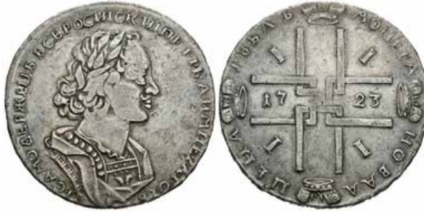
767 Rusia. Peter I. 1 rublo. 1723. Moscú. (Km-162.1). (Dav-1657). Ag. 27,85 g. MBC+. Est...1200,00. 800