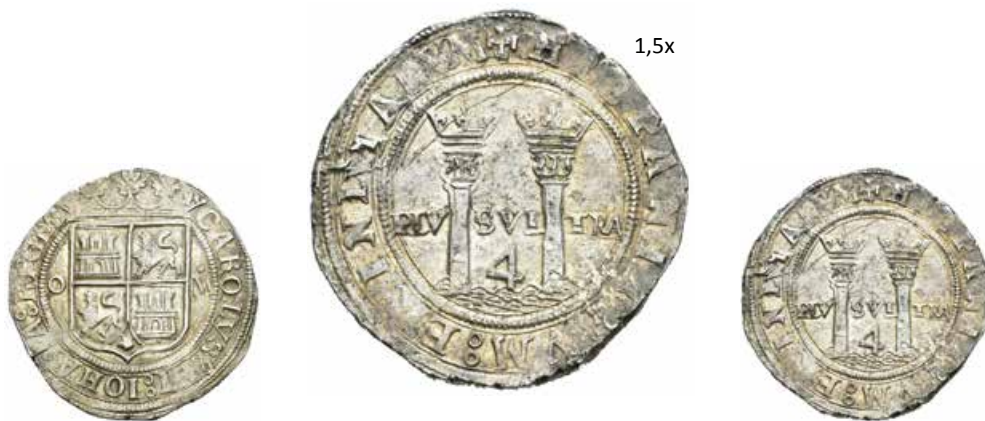
273 4 reales. México. O. (Cal-89). Ag. 13,70 g. Escudo entre O-M. Restos de brillo original. Bellísima. EBC/EBC+. Est...600,00.