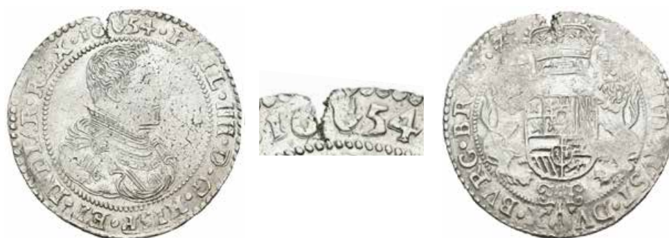
321 Ducatón. 1654. Amberes. (Vic-1242). (Vanhoudt-642.AN). (Delm-284). Ag. 32,20 g. Grieta de acuñación. Leves oxidaciones limpiadas en reverso. EBC-. Est...275,00.