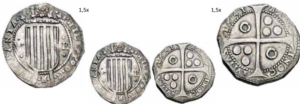
319 Levantamiento de Cataluña. 5 reales. 1641. Barcelona. (Cal-36). Ag. 12,54 g. Buen ejemplar para este tipo. EBC-. Est...600,00.