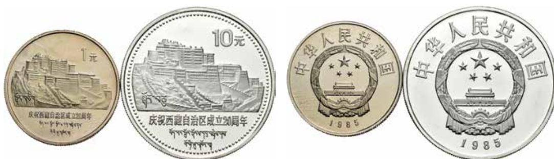
714 China. 1985. Lote de 2 monedas, 1 yuan (nickel) y 10 yuan (plata). 30º Aniversario de la Autonomía del Tibet. En estuche original y con certificado oficial. PROOF. Est...1600,00.