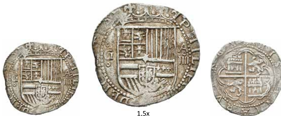
277 4 reales. Sin fecha. Granada. A. (Cal-291). Ag. 13,66 g. Leones del reverso grandes. Muy escasa. MBC+. Est...350,00.