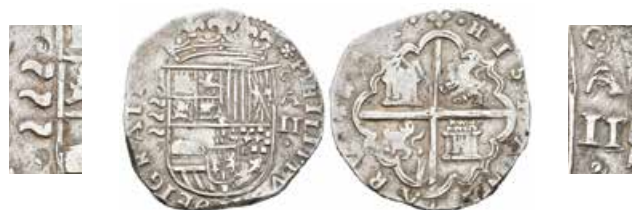
276 2 reales. Sin fecha. Valladolid. A. (Cal-588 variante). Ag. 6,76 g. Tres jirones entre puntos. MBC. Est...200,00.