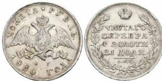
771 Rusia. Nicholas I. 1 rublo. 1830. San Petesburgo. (Dav-282). (Km-161). (Bitkin-109). Ag. 20,91 g. MBC+. Est...300,00. 250