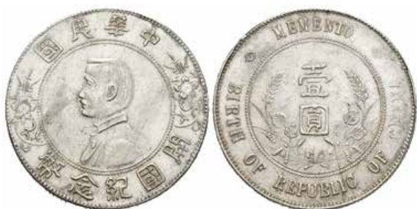
713 China. Sun Yat-sen. Dollar. 1927. (Km-Y318a.1). Ag. 26,76 g. Memento. Brillo original. EBC+. Est...180,00.