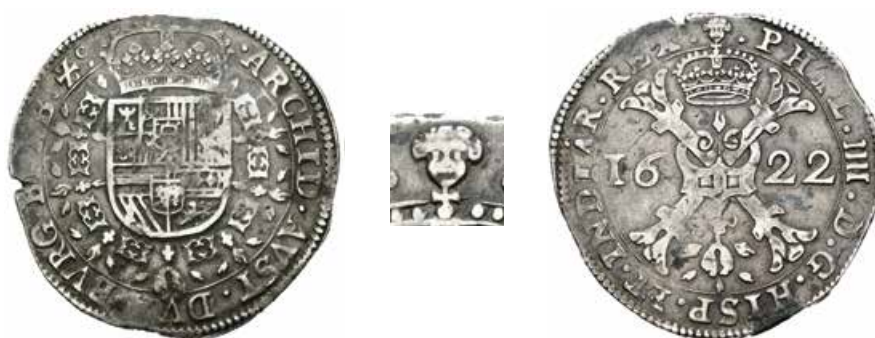
320 Patagón. 1622. Bruselas. (Vanhoudt-645). (Delm-295). (Vic-996). Ag. 27,74 g. MBC+. Est...200,00.