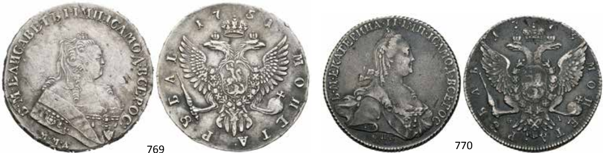
769 Rusia. Elizabeth I. 1 rublo. 1751. Moscú. MMA. (Km-C19.2). (Bitkin-123). Ag. 25,40 g. Rara. MBC+. Est...350,00. 200