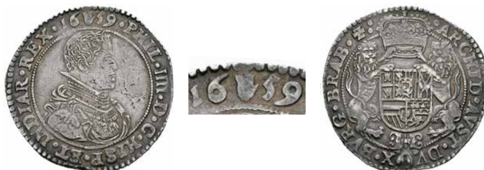
322 Ducatón. 1659. Amberes. (Vic-1247). Ag. 32,52 g. MBC+. Est...200,00.