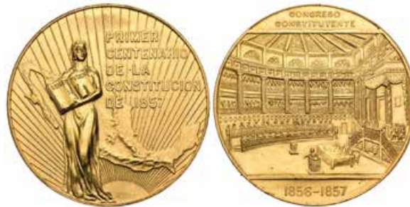
778 México . Medalla en oro. 1957. Au. 41,66 g. Primer Centenario de la Constitución. 37 mm. SC. Est...1100,00.